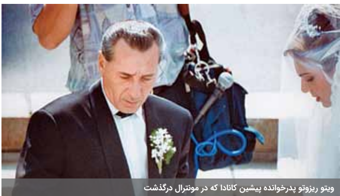
ویتو ریزوتو پدرخوانده پیشین کانادا که در مونترآل درگذشت

کارتل‌های مواد مخدر مکزیک برای تقویت نفوذ خود در کانادا، از طریق سیستم‌های پیام‌رسانی رمزگذاری شده با گروه‌های جدید و کوچک ارتباط برقرار می‌کنند. بیشتر این گروه‌ها مانند اتحادیه‌ی گرگ‌ها بسیار فعال هستند. ناجرا، پیش از خروج اجباری خود از مکزیک به عنوان پناهجو، در شهر سیدود خوارس به عنوان روزنامه‌نگار در مورد کارتل‌های مواد مخدر تحقیق می‌کرد. او می‌گوید: «در دنیای امروز، از طریق اینترنت به منابع بسیاری می‌توان دست یافت؛ مانند اطلاعات شخصی، راه‌های تماس، ارتباطات فوری. حتی می‌توان آدمکش استخدام کرد یا اسلحه خرید.»